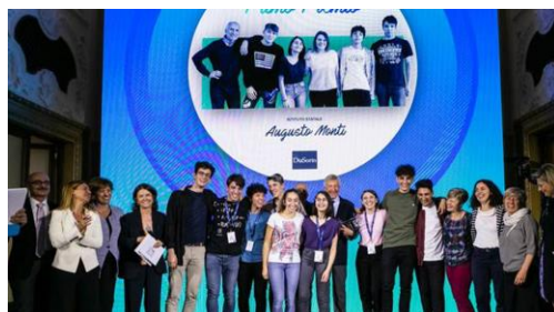
la vittoria a Mad for Science 2018

Pertanto, al termine del quinquennio, gli studenti possono accedere con successo a tutti gli studi universitari e possiedono competenze avanzate per quelli di carattere scientifico e tecnico .